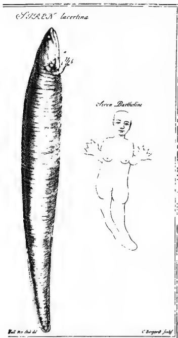
Fig. 2 Reproduction de la planche de l'édition originale de la dissertation d'OSTERDAM (1766) sur Siren lacertina (Bibliothèque Nationale, Paris).